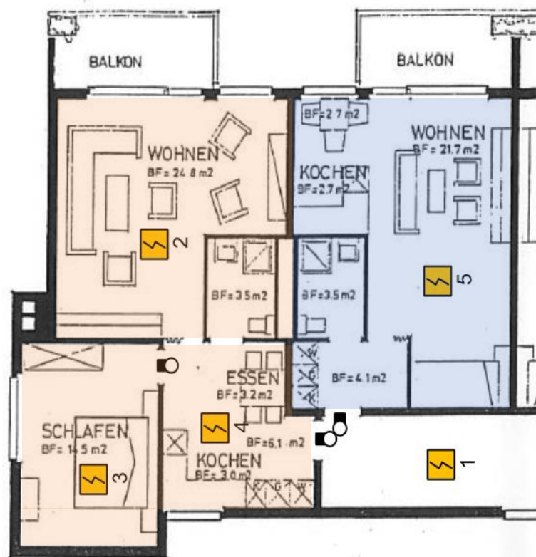
Beispiel A 2-Zimmer Wohnung mit Balkon